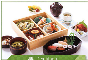
椿 (つばき) 寿司会席 (椿) 6,050円