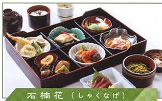
石楠花 (しゃくなげ) 石楠花 5,060円